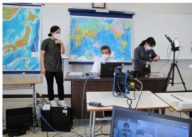
富山高専実習ライブ配信風景