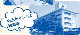
射水キャンパス 和海寮