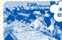
本郷キャンパス 仰岳寮