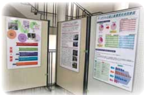
高専祭における企画展示