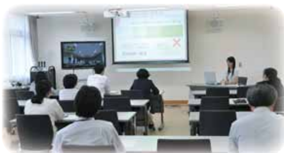
県内企業女性管理職による講演会 (「『ありたい自分』と『求められる自分』のために ー中小企業から見た高専女子学生の就職活動ー」)