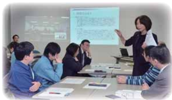
海外女性企業家による講演会・意見交換会