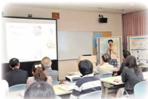
女子大学院生のためのオープンセミナー アカデミックキャリア-高専教員への道-