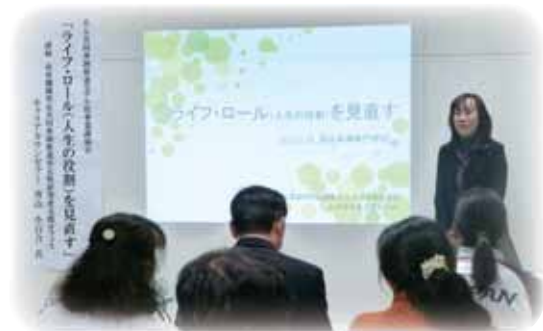
高専機構キャリアカウンセラー講演会(「ライフ・ロール(人生の役割)を見直す」)