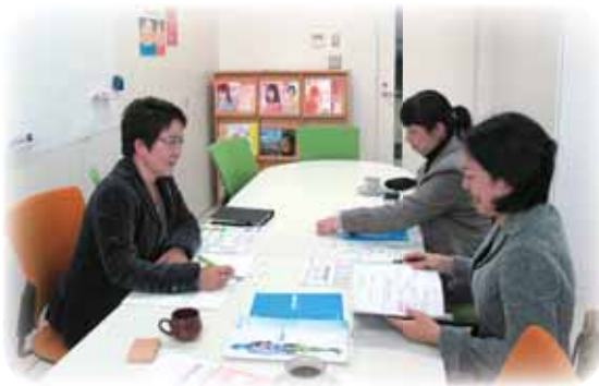
他機関への訪問調査