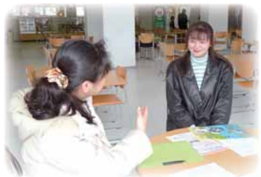
女子学生へのインタビュー