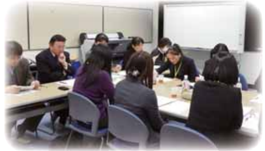
東海北陸地区高専女性教職員との懇談会