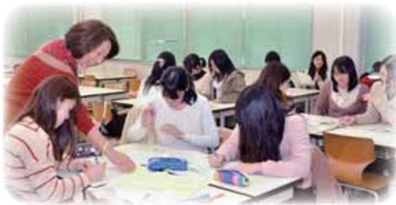
女子学生対象ワークショップ(「グローバル企業にアピールするにはー女性にとって起業とはー」)