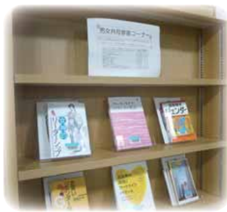
男女共同参画図書コーナー