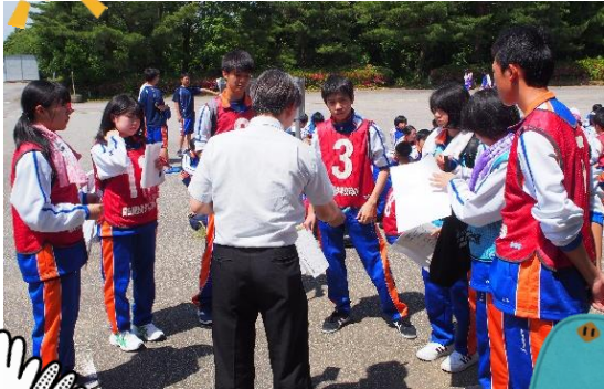
オリエンテーリングの様子

大変興味深かったです。2日目は、スマートフォン講習会を受けました。SNSの使い方を学びました。昼からは、のとじま水族館へ行き海洋生物の生態について学びました。そして、この合宿では自らが部屋長として、活動の時間等を常に気を配りました。この合宿で学んだ数多くのことを日々の生活と照らし合わせ、活かしていきたいです。