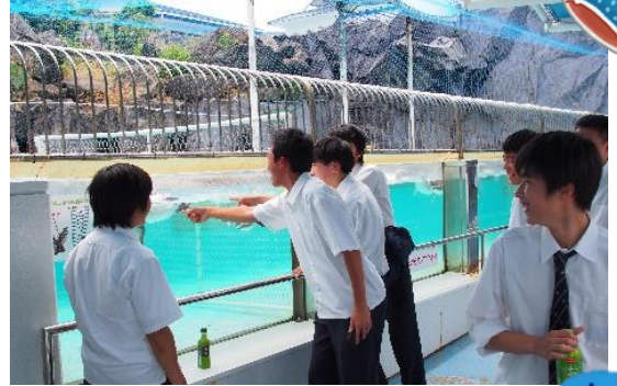
のとじま水族館での様子